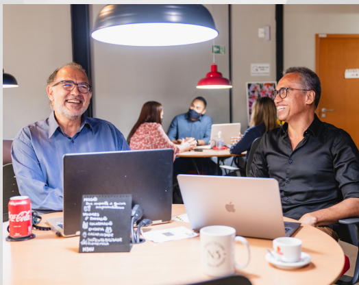
Estação de Trabalho N3 Coworking

+ EXPOSIÇÃO DE NEGÓCIOS NO PARQUE SHOPPING MACEIÓ